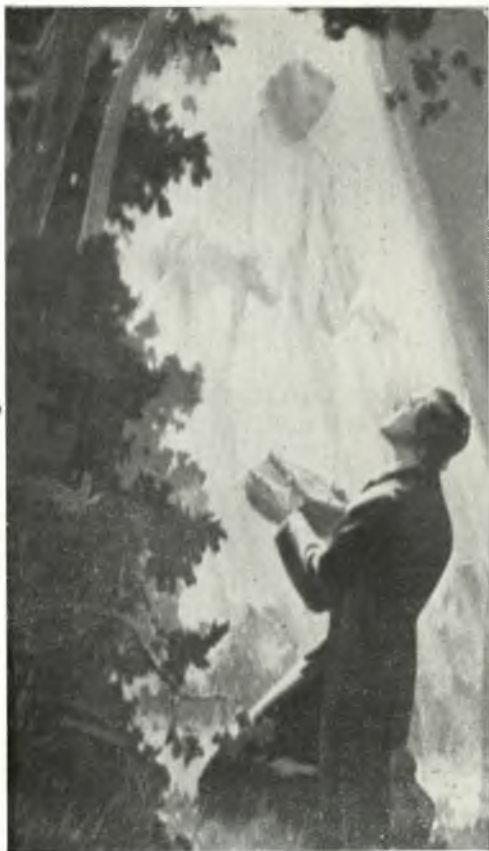
Muralha da Capela de Cody, Wyoming, U.S.A. mostrando a restauração do evangelho por seres ressuscitados ao Profeta Joseph Smith cem anos atrás.

A chamada Igreja “Mormon” tem o Evangelho de Jesus Cristo, inalterado, que foi restaurado na terra pela ministração dos anjos em nossos dias. Ele oferece uma visão de melhor vida, não propriamente no futuro, mas aqui, agora. Ele é tão adaptável ao “mais fraco dos mortais” assim como ao mais forte dos homens.