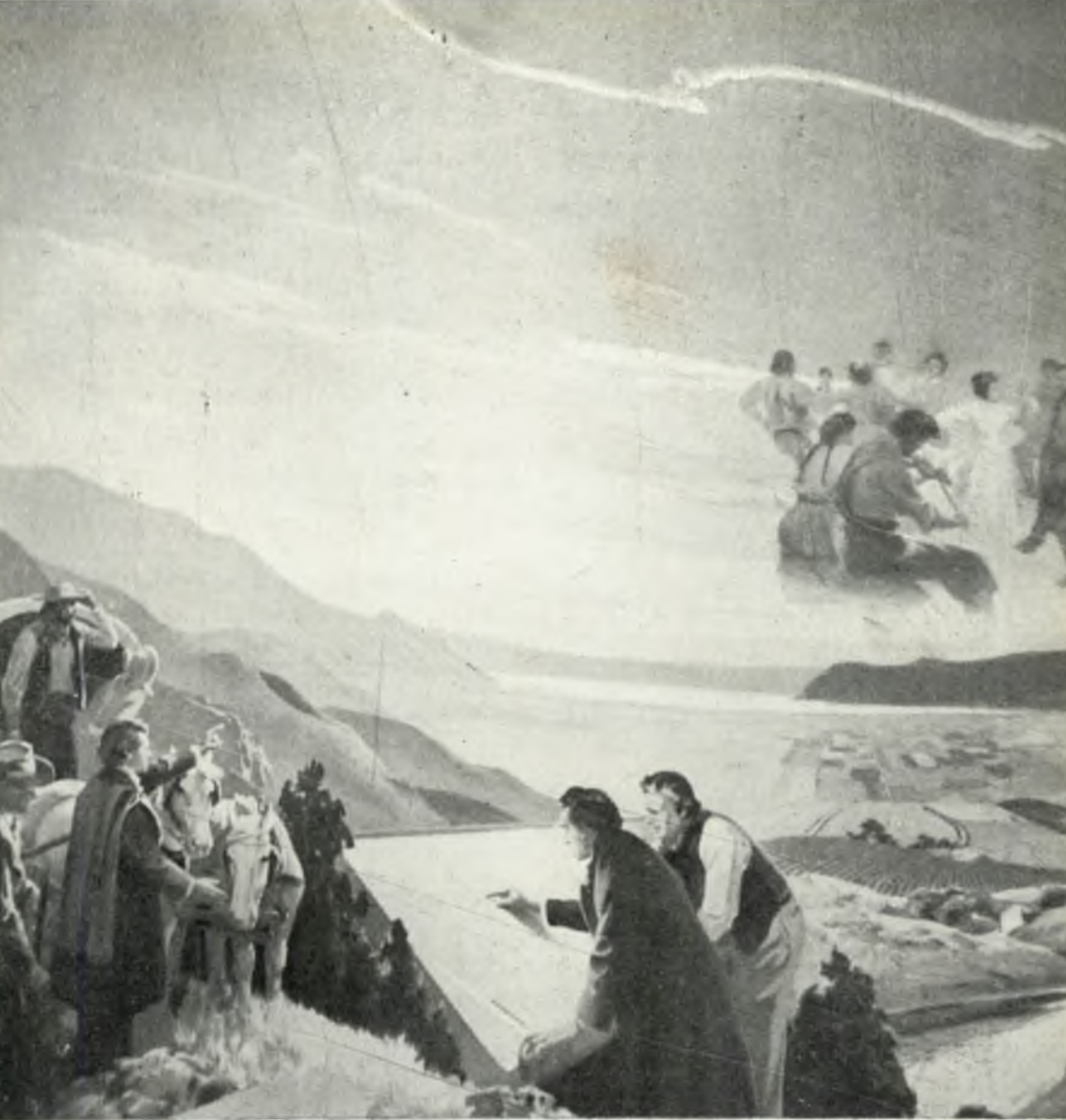
Chegada dos Pioneros Mormons em Utah