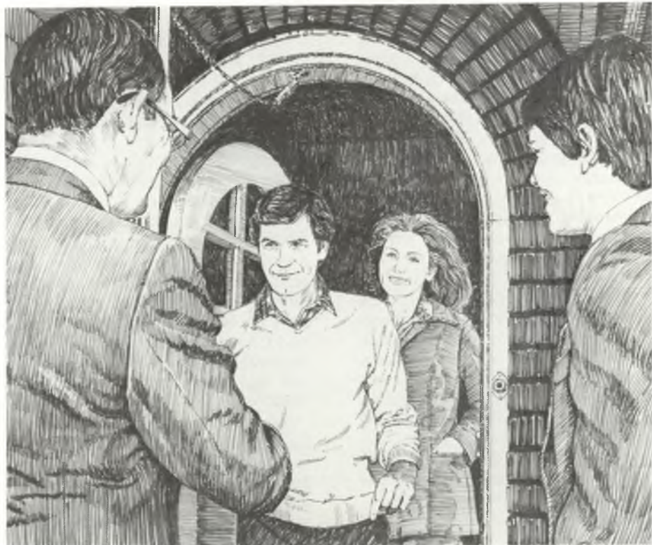
Ilustrado por Robert Barrett

Tal distinção é um ponto crítico. Se ensinarmos mais do que a família é capaz de ouvir e aceitar, corremos o risco de criar uma situação negativa. A família coloca-se na defensiva, deixa de nos dar atenção ou pede que paremos de ensiná-la. A mensagem não é assimilada, o Espí-