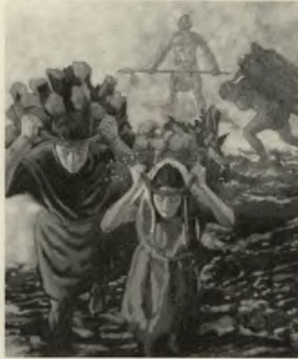
ILUSTRADO POR DOUG FAKKEL

Outras vezes, ser manso significa tomar alguma atitude, como quando Moisés (que, de acordo com as escrituras, estava entre os mais mansos dos mortais) tirou os israelitas do cativeiro egípcio (ver Números 12:3). Uma pessoa precisa de mansidão para abandonar o tipo de vida a que está acostumada e filiar-se à Igreja, ou para aceitar um chamado missionário, ou para resistir a uma tentação e tomar uma atitude correta. Mansidão é humilde submissão à vontade do Senhor.