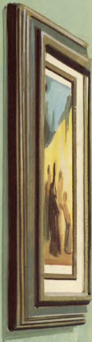
JESUS CURA O CEGO, DE CARL HEINRICH BLOCH; ILUSTRADO POR PAUL MANN

Jamais entendera essa escritura. Jesus curara o cego para que as obras de Deus se manifestassem. Mas, e quanto a todos aqueles que não são curados? E quanto a minha irmã inválida, que morrera quando eu era