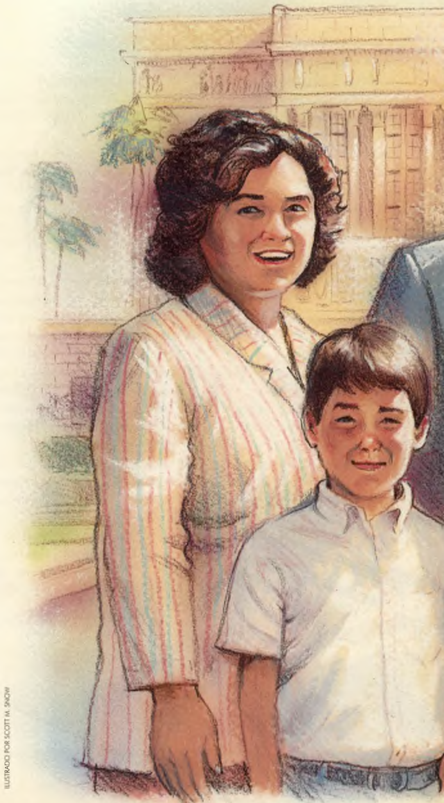
ILUSTRADO POR SCOTT M. SNOW